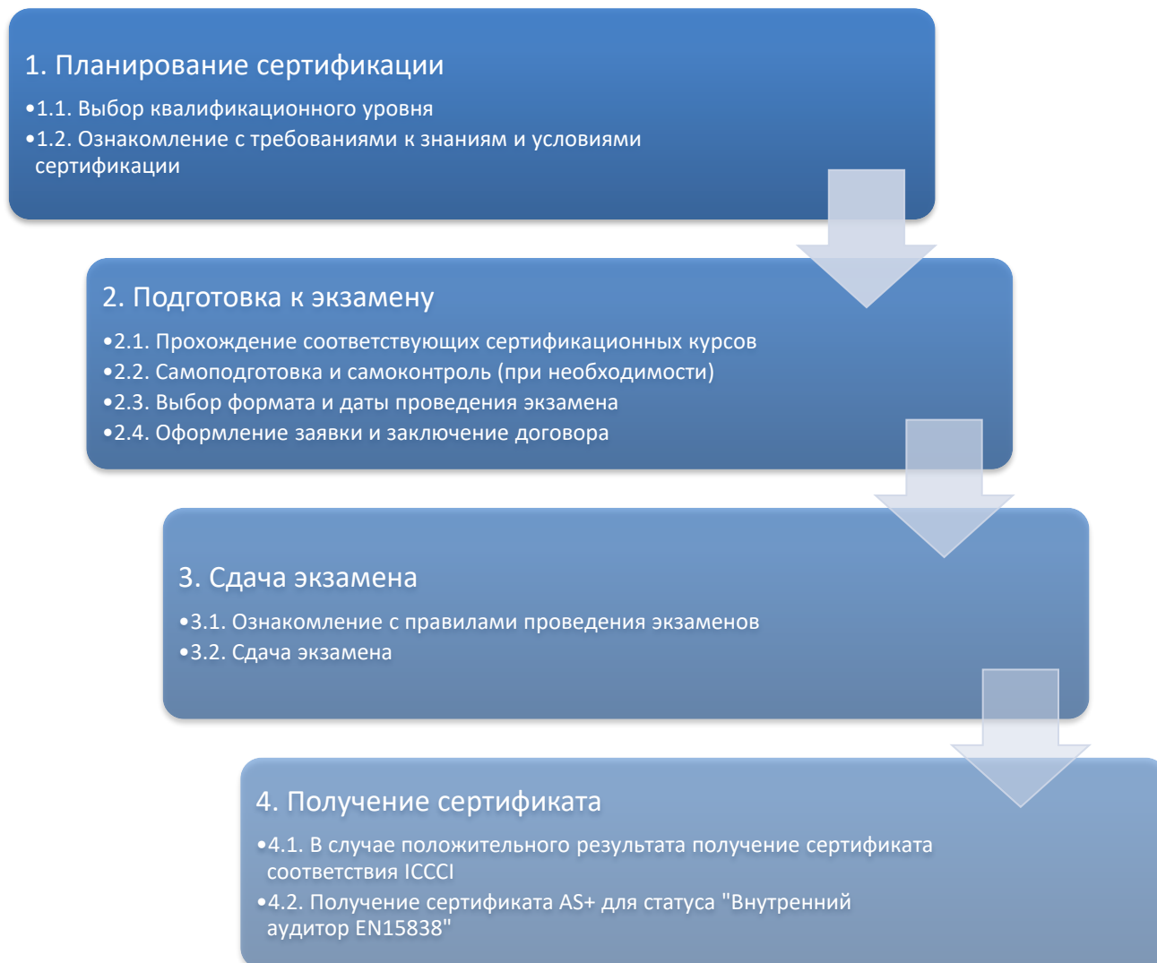
Рисунок 2. Процесс сертификации